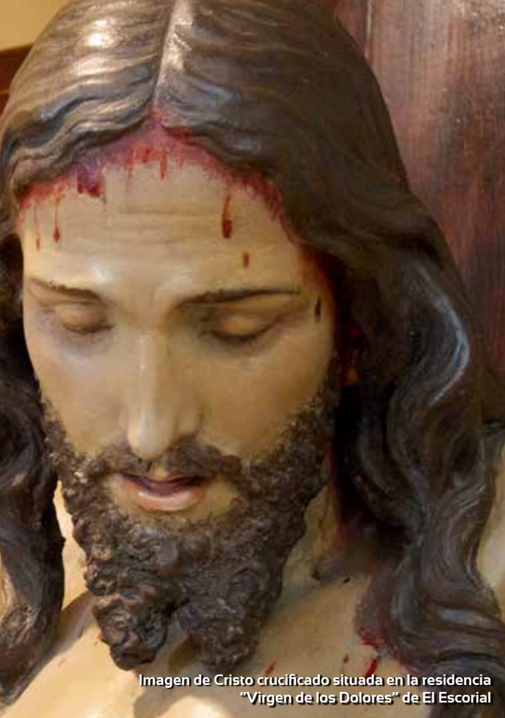
Imagen de Cristo crucificado situada en la residencia "Virgen de los Dolores" de El Escorial

Durante este camino de cuarenta días, una sola cosa debe ocupar nuestra mente y nuestro corazón: la conversión, el cambio de vida, a través de la oración, la penitencia y la mortificación.