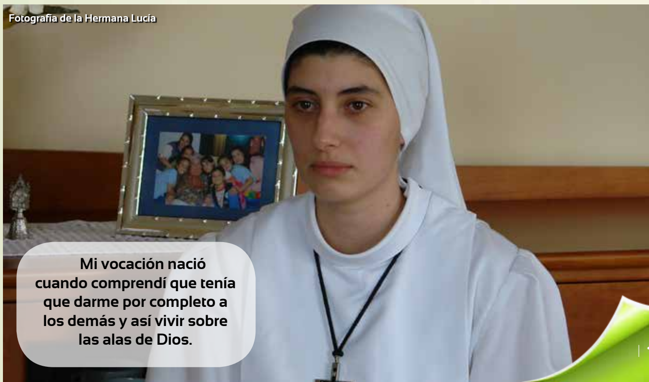
Fotografía de la Hermana Lúcia

Mi vocación nació cuando comprendí que tenía que darme por completo a los demás y así vivir sobre las alas de Dios.