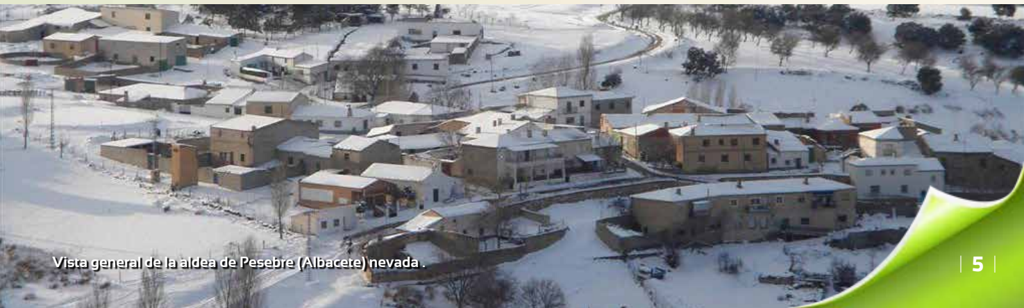
Vista general de la aldea de Pesebre (Albacete) nevada.