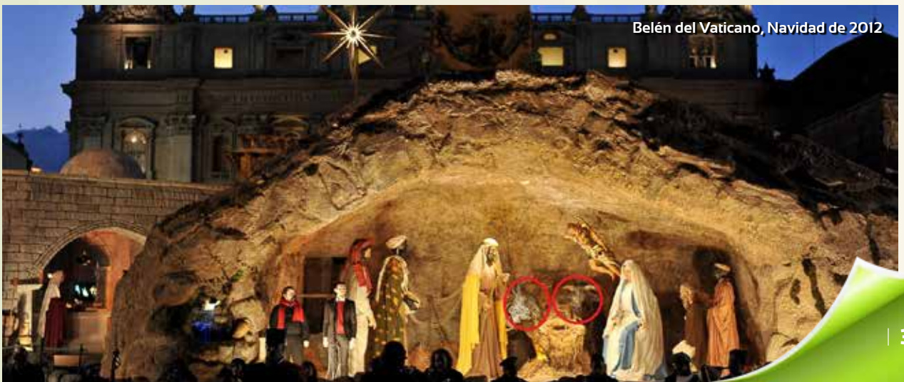
Belén del Vaticano, Navidad de 2012

Atrás queda la polémica por lo que supuestamente aparecía en el reciente libro La infancia de Jesús de Benedicto XVI. Se atribuía al Papa haber dicho que en el portal de Belén no había ni buey ni mula. Pues bien, de esto nada de nada; sino más bien lo contrario, pues, concluía el Santo Padre en su libro: « Ninguna representación del Nacimiento renunciará al buey y al asno » (pp. 76-77). Por eso, durante los días de Navidad, pudimos contemplar en la plaza de San Pedro, en Roma, el tradicional portal de belén, que incluía un año más —como siempre— las figuras del buey y la mula.