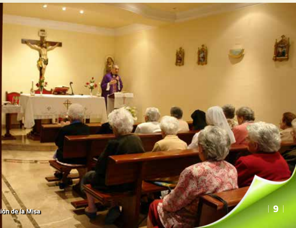
Capilla de la residencia durante la celebración de la Misa