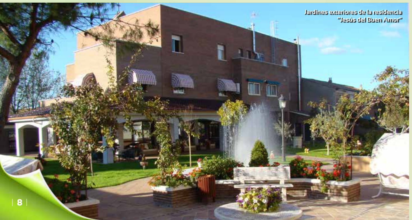
Jardines exteriores de la residencia "Jesús del Buen Amor"

Sus zonas ajardinadas, fácilmente accesibles, dan paso al solárium o zona reservada para tomar el sol; todo para disfrute de los ancianos. También dispone esta residencia de amplios locales dedicados a la lavandería, donde las Hermanas lavan la ropa y la ordenan con delicadeza. Especial atención tiene la cocina,